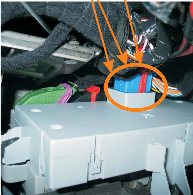
MODUŁ STERUJĄCY (TYŁ)